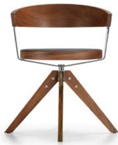
Swivel chair with four-prong base in wood Bureaustoel met vierpoots voet van hout