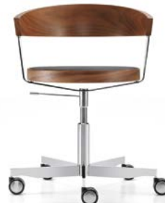
Swivel chair with five-prong base in steel Bureaustoel met vijfteens onderstel van staal