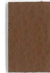
2488 Cognac cognac