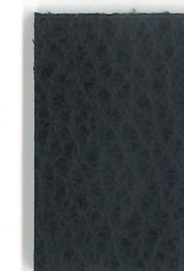
0500 Schwarz black