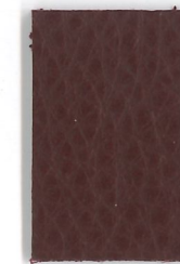
4223 Burgund burgundy