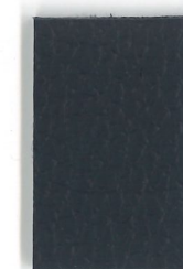
5150 Nachtblau nightblue