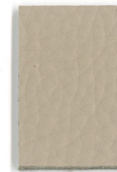
9266 Sesam sesame

SoftArt. ® Leather with timeless tradition