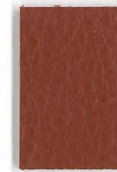
4468 Terrakotta terracotta