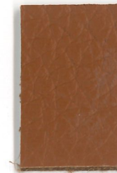
2513 Haselnuss hazel