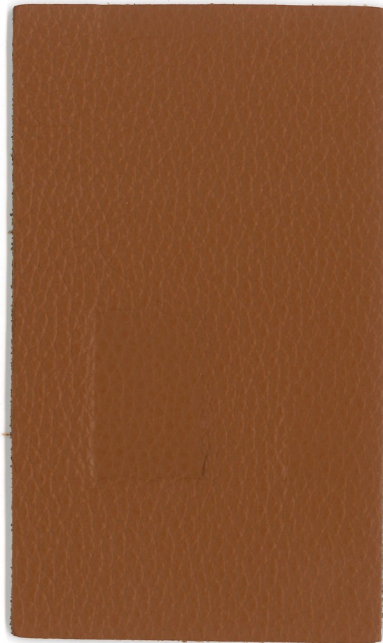
2513 Haselnuss hazel

SoftArt. ® Leather with timeless tradition