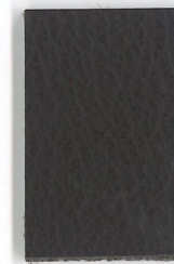
2213 Kaffee coffee