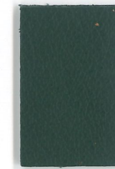
7294 Moos moss