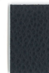
5046 Schwarzblau blackblue