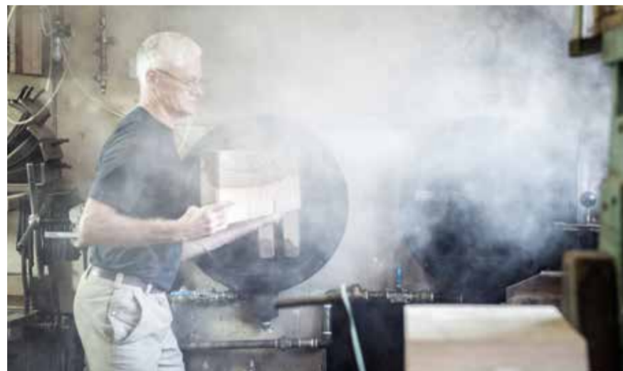
Les pièces de bois sont coupées à la longueur exacte et étuvées plus ou moins longtemps en fonction de leur section. Les pièces en bois sont ensuite courbées selon le fameux processus de cintrage du bois à la vapeur effectué par l'entreprise de cintrage du bois K. Winkler AG à Felsenau (CH).