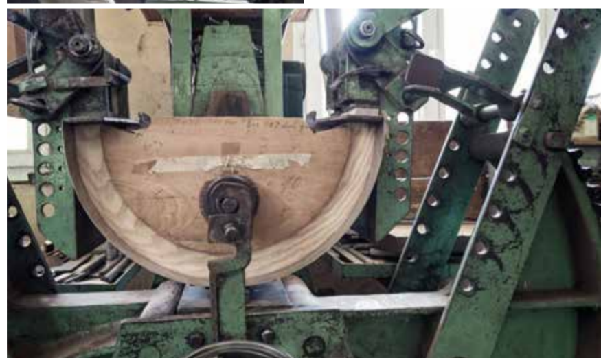
Les divers composants sont intégralement transformés, jusqu'au siège achevé, dans les ateliers de Girsberger à Bützberg près de Berne.