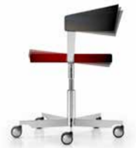
Grâce à la structure flexible en U, qui supporte l'assise et le dossier, un mouvement de balancier est possible en position assise, sans l'aide d'aucun mécanisme.

A mon avis, le G 125 est l'exact contre-projet des sièges de bureau actuels, dont les fonctionnalités et les possibilités de réglage ne cessent d'être développées, mais qui parlent de moins en moins à nos sens. Selon moi, il représente le siège idéal dans nos intérieurs. Là, où l'on ne travaille pas toute la journée, tout au plus quelques heures – mais où l'on souhaite disposer d'un siège pivotant, et également d'un beau meuble.