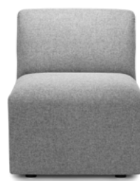
Middle module Tussenelement