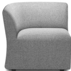
Positive corner module Hoekelement positieve