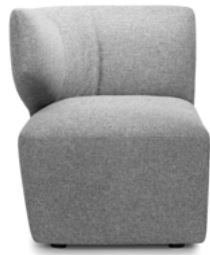
End module, armrest right Eindelement AL rechts