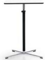
Working table Werktafel

Pablo Soft Modular offers especially soft and comfortable upholstery with its characteristic informal cover and folded details. The modules can be arranged to form virtually any seating configuration. The only limit is your imagination. There are just a few elements. The end modules with armrests, linear middle elements, plus positive and negative corner elements can be connected as desired. A simple linking mechanism ensures that the modules fit together exactly. Thanks to the modular construction, the shape of the seating groups can be changed quickly and easily, meaning that Pablo can be adapted to new office situations at any time. The modules can also be combined with all the other Pablo models. These include a lounge chair, two-seater, stool, side table and working table.