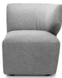
End module, armrest left Eindelement AL links