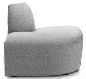
Negative corner module Hoekelement negatieve