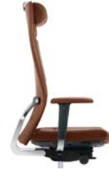
_3 Sitztiefenverstellung Réglage de la profondeur d'assise