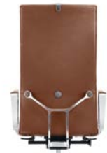
_2 Aluring Armlehnen Accoudoirs alu circulaires