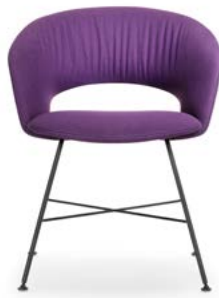
Vierbeinstuhl mit Kreuzstrebe Siège quatre pieds avec croisillon