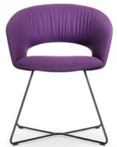
Kufenstuhl Siège piétement traineau