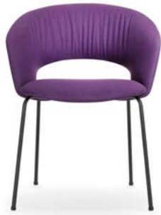
Vierbeinstuhl Siège quatre pieds