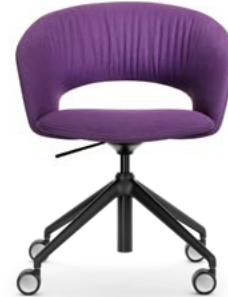
Drehstuhl höhenverstellbar mit Rollen Siège pivotant, réglable en hauteur avec roulettes