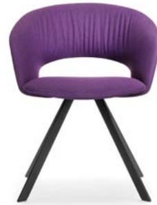
Vierbeinstuhl Flachrohr Siège quatre pied, tubulaires plats