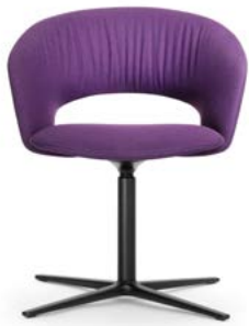
Drehstuhl Siège pivotant