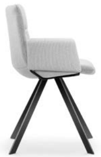
Vierbeinstuhl Rundrohr Siège quatre pieds, tubulaires rond