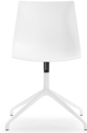
Drehstuhl Siège de bureau