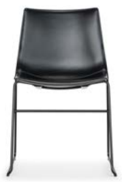
Vollposter Kernleder Rembourrage en cuir pleine fleur

Die organisch geformte Kunststoffsitzschale mit klaren und fließenden Linien macht Nava zu einem eleganten und komfortablen Stuhl, der sich im Wohnbereich wie auch im Gastronomiebereich einsetzen lässt. Beim Zurücklehnen gibt die Lehne angenehm nach und bietet auch bei langem Sitzen einen hohen Komfort. Sie besteht aus Post-Consumer-Rezyklat (mit Ausnahme der ungepolsterten Ausführungen in schwarz, weiss, stahlblau und silber). Die Schale kann mit einem Sitzkissen ausgerüstet werden oder in den Vollpolstervarianten linear oder konturiert bezogen werden, welche dem Stuhl einen besonders wohnlichen Charakter verleihen. Nava ist als stapelbarer Vierbeinstuhl mit und ohne Armlehnen, als Kufenstuhl, als Drehstuhl und mit Holzgestell erhältlich. Das Kufengestell gibt es in einer niedrigen und einer hohen Ausführung, so dass Nava auch an Stehtischen oder Küchentresen eingesetzt werden kann. Aufgrund der weitreichenden Gestell-, Material- und Polsteroptionen lassen sich mit Nava vielfältige und individuelle Ausführungen bilden.