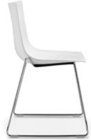
Kufenstuhl Siège piétement traineau