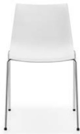
Vierbeinstuhl Siège quatre pieds