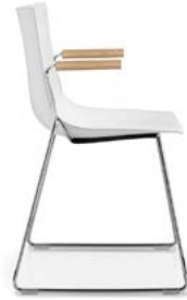
Kufenstuhl mit Armlehnen Siège piétement traineau avec acc.