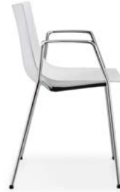
Vierbeinstuhl mit Armlehnen Siège quatre pieds avec accoudoirs