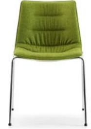
Vollposter konturiert Rembourrage intégral contourné