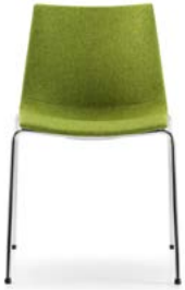
Vollposter linear Rembourrage intégral linéaire