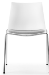
Sitzpolster Coussin d'assise