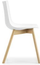
Vierbeinstuhl Holz Siège quatre pieds en bois