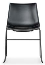
Vollposter Kernleder Rembourrage en cuir pleine fleur

Die organisch geformte Kunststoffsitzschale mit klaren und fließenden Linien macht Nava zu einem eleganten und komfortablen Stuhl, der sich im Wohnbereich wie auch im Gastronomiebereich einsetzen lässt. Beim Zurücklehnen gibt die Lehne angenehm nach und bietet auch bei langem Sitzen einen hohen Komfort. Sie besteht aus Post-Consumer-Rezyklat (mit Ausnahme der ungepolsterten Ausführungen in schwarz, weiss, stahlblau und silber). Die Schale kann mit einem Sitzkissen ausgerüstet werden oder in den Vollpolstervarianten linear oder konturiert bezogen werden, welche dem Stuhl einen besonders wohnlichen Charakter verleihen. Nava ist als stapelbarer Vierbeinstuhl mit und ohne Armlehnen, als Kufenstuhl, als Drehstuhl und mit Holzgestell erhältlich. Das Kufengestell gibt es in einer niedrigen und einer hohen Ausführung, so dass Nava auch an Stehtischen oder Küchentresen eingesetzt werden kann. Aufgrund der weitreichenden Gestell-, Material- und Polsteroptionen lassen sich mit Nava vielfältige und individuelle Ausführungen bilden.