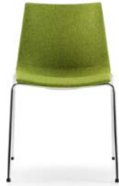
Vollposter linear Rembourrage intégral linéaire