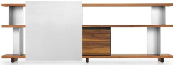
Typ 4 - 1x Element 22, 1x Element 33 Type 4 - 1x élément 22, 1x élément 33