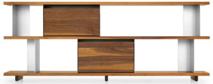
Typ 5 - 2x Element 33 Type 5 - 2x élément 33