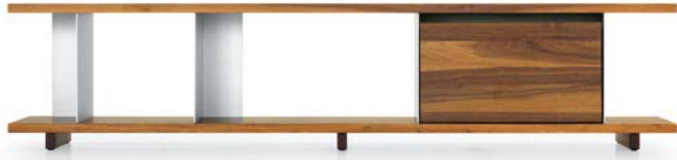
Type 2 - 1x Element 33 Typ 2 - 1x Element 33