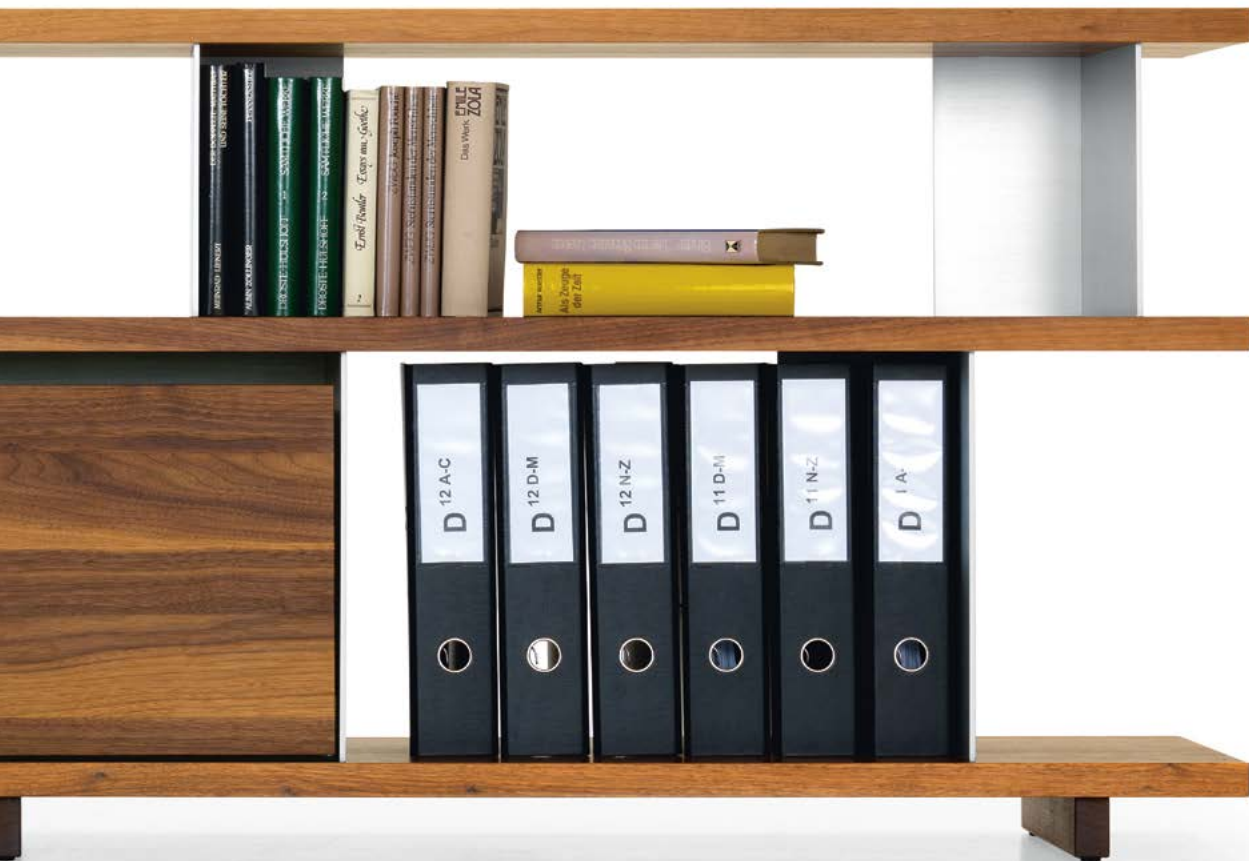
Type 5 - 2x Element 33