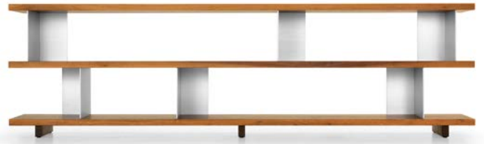
Type 3 - 2x Element 22 Typ 3 - 2x Element 22