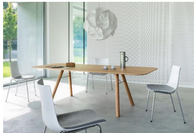
„Akio“ in Eiche und als runder und rechteckiger Tisch – jeweils mit dem Schalenstuhl „Nava“