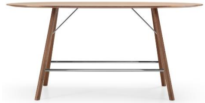
„Akio“ ist mit unterschiedlichen Tischplattenformen, in Eiche und Nussbaum sowie in zwei Höhen verfügbar. Rechts: als High Desk mit Fussreling