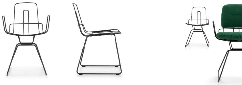
„Alambre“ ist mit und ohne Armlehnen, ohne und mit Sitz- und Rückenkissen erhältlich

Diese und weitere Abbildungen können sowohl in Web-Qualität als auch in hoher Auflösung von der Girsberger-Bilddatenbank heruntergeladen werden.