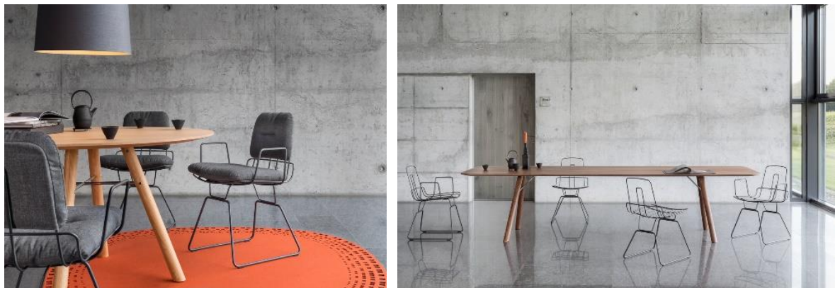
„Alambre“ in Kombination mit dem Tisch „Akio“ in Eiche (links) und in Nussbaum (rechts)

Ausführliche Informationen finden Sie unter www.girsberger.com .