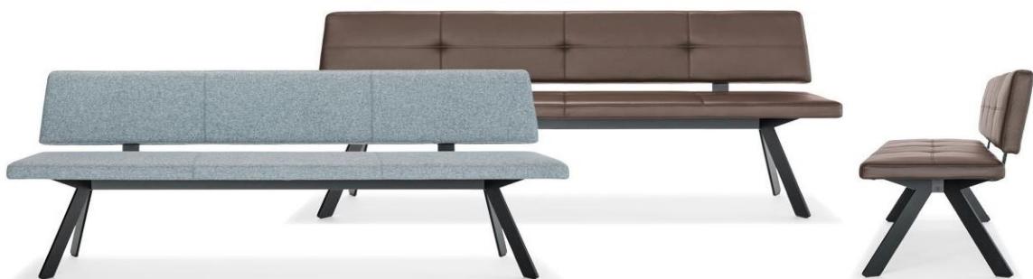
„Carim“ mit A-Fussgestell

Design: Atelier I+N / Ismaël und Nathan Studer