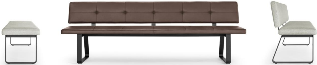
„Carim“ mit Bügelfussgestell

Der Massivholztisch „Linar“ verfügt über eine Vierbein-Flachstahlstruktur, welche ihn schlank und filigran wirken lässt. Dabei zeichnet sich das Gestell durch eine hohe Standfestigkeit aus, welche Tische bis zu 4 Metern Länge ermöglicht. Die Kanten der Massivholzplatte sind zum Rand hin abgeschrägt, was den filigranen Charakter des Tisches zusätzlich verstärkt. Alle Holzarten und Oberflächenausführungen der Girsberger Massivholzkollektion stehen zur Wahl.