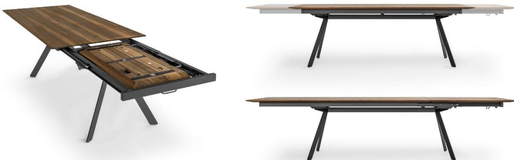
„Barra“ – neu als Auszugstisch

Design: Atelier I+N / Ismaël und Nathan Studer