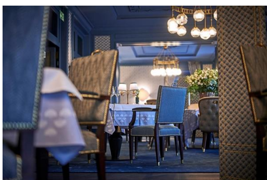
Le mobilier des espaces classés ou des intérieurs historiques constitue un domaine d'application spécifique. Exemple: Club Baur au Lac, Zurich. Architecture d'intérieur: Claudia Silberschmidt d'atelier zürich