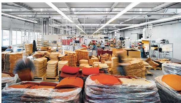
Aperçu de l'atelier de Remanufacturing de Girsberger Sarl à Endingen. Des manufactures regroupant différentes disciplines et une compétence industrielle de pointe permettent de mettre en œuvre des processus à la fois très artisanaux et efficaces.