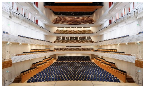
Exemple de référence: le Centre de culture et de congrès de Lucerne: Le mécanisme de basculement ainsi que les coussins d'assise et de dossier des 1898 sièges de la salle ont été entièrement rénovés en cinq étapes. Le déroulement des activités de la salle de concert n'a nullement été perturbé.