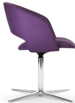
Zijaanzicht in de comfortuitvoering met tot de achteropening verlengde leuning