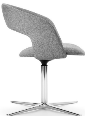
Zijaanzicht met een smalle rugleuning