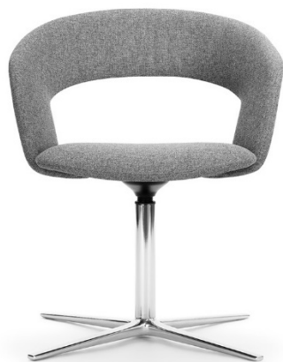
Calina in de uitvoering met een smalle rugleuning

In de uitvoering met de in hoogte verstelbare vijfstervoet op wielen is Calina ook een aantrekkelijke draaistoel voor tijdelijk werken of een comfortabele werkstoel voor het thuishkantoor.