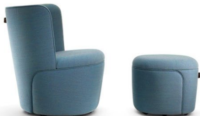
Ein Hocker ergänzt den Sessel. Die besondere Linien- und Nahtführung betont die skulpturale Form der beiden Möbel.