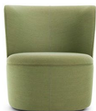
Vorderansicht von Cina

Die charakteristische Formgebung des Sessels wird durch die Nahtführung unterstrichen. Der Handgriff aus Leder auf der Rückseite erleichtert die Handhabung und ist ein schönes Detail, welches auf die Beweglichkeit des Sessels hinweist.