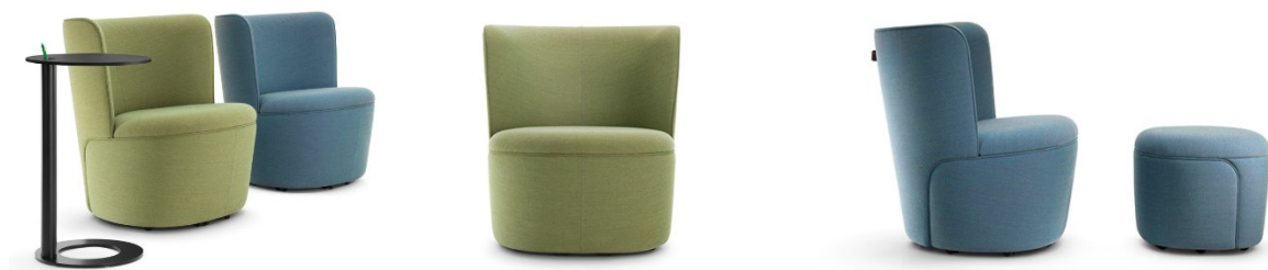
Fauteuil de salon Cina - complété par la table d'appoint Tala (photo de gauche) ainsi que par le tabouret assorti (photo de droite)