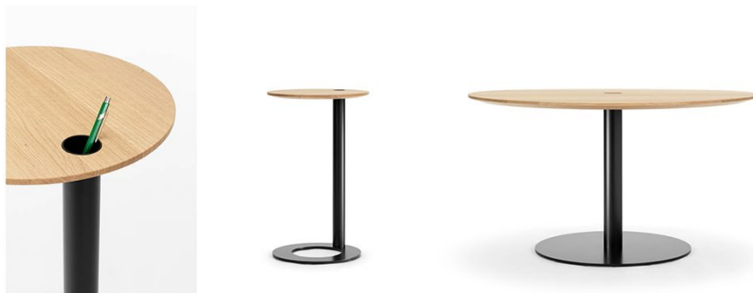
Tala avec réceptacle pour instruments d'écriture: comme table d'appoint et comme table ronde pour les petites réunions